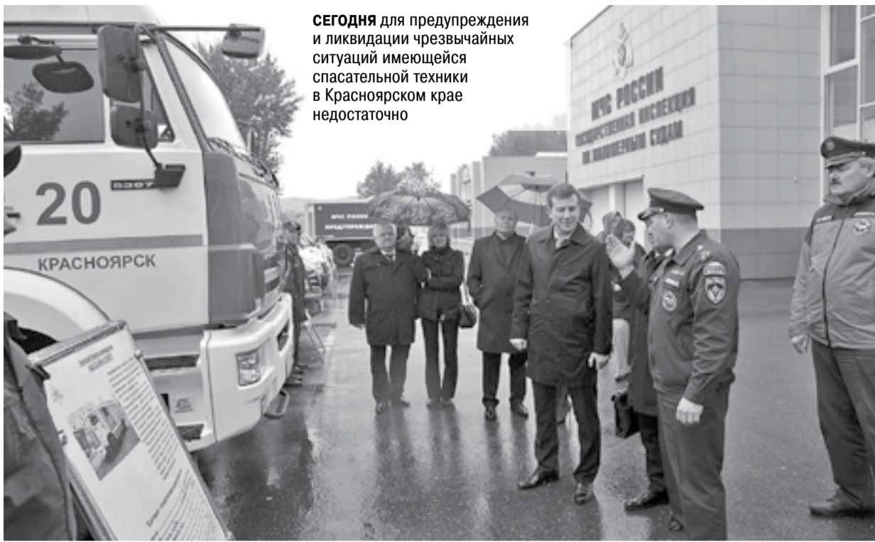
СЕГОДНЯ для предупреждения и ликвидации чрезвычайных ситуаций имеющейся спасательной техники в Красноярском крае недостаточно