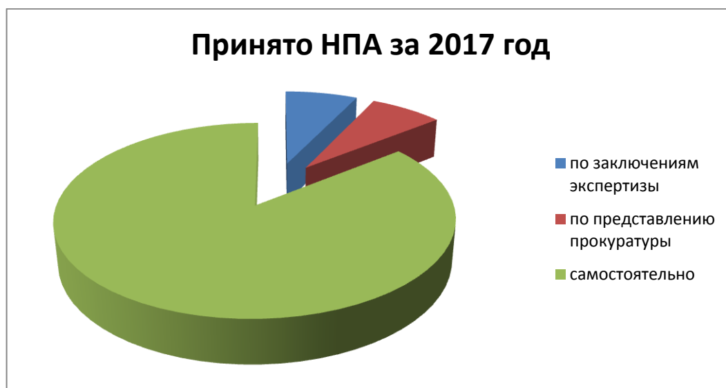
Диаграмма 1. Соотношение принятых НПА по результатам заключений экспертизы или представлений прокуратуры за 2017 год

В целях устранения недочетов, выявленных по результатам заключения экспертного управления Администрации Губернатора края, и приведения нормативно-правовых актов в соответствие с действующим законодательством в 2017 году принято 2 решения (7%), в 2018 году – 7 решений (27%); по результатам представлений и протестов прокуратуры Большеулуйского района в 2017 году – 2 решения (7%), в 2018 году – 6 решений (23%).