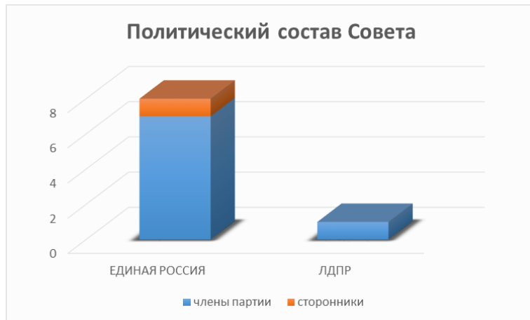
Рис.1. Политический состав Каратузского сельского Совета депутатов

В сельском Совете депутатов V созыва работают девять депутатов, избранных в сентябре 2015 года, из них 8 депутатов – члены и сторонники Всероссийской политической партии «ЕДИНАЯ РОССИЯ», один депутат от политической партии ЛДПР (рис. 1).