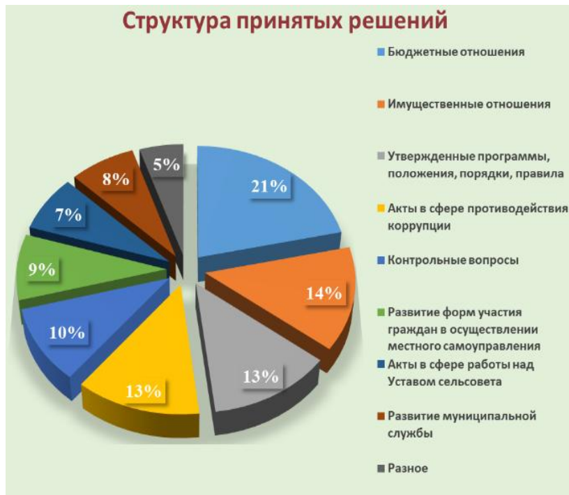
Рис. 2. Основные направления правотворческой деятельности

Но, рассматривая нормотворческий процесс, нельзя ограничиться лишь изданием нормативных актов, этот процесс включает в себя широкий круг отдельных составных частей. Кроме разработки, обсуждения и принятия правовых актов, немаловажны мониторинг и приведение нормативно-правовой базы в соответствие с действующим законодательством, обсуждение проектов решений на публичных слушаниях.